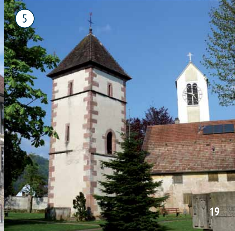
Bild 1: Blick auf Biberach und die Kinzig Bild 2: Burgruine Hohengeroldseck, Seelbach Bild 3: St. Mauritius Kirche, Prinzbach Bild 4: Museum Kettererhaus, Biberach Bild 5: St. Blasius Kirche, Biberach