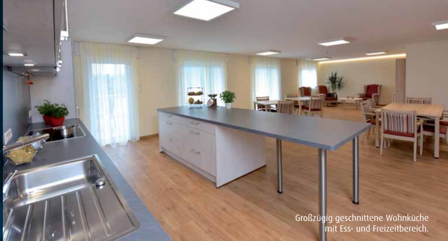
Großzügig geschnittene Wohnküche mit Ess- und Freizeitbereich.